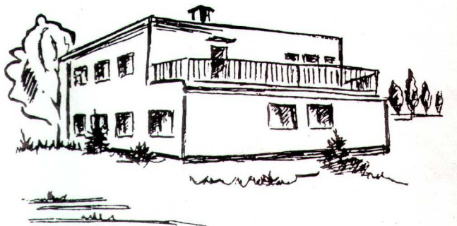
Modlitebna CASD v Dětmarovicích v domě čp. 454