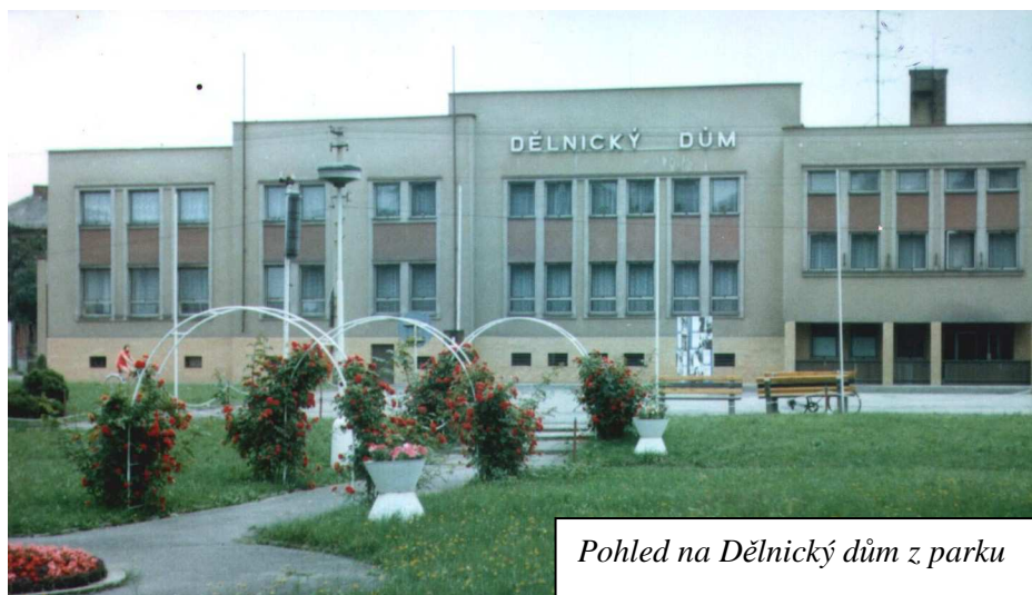
Pohled na Dělnický dům z parku