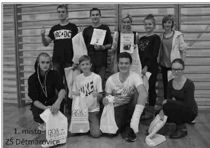
1. místo ZŠ Děťmarovice

složit ne zrovna jednoduchý elektrický obvod nebo pracovat s mikroskopy, v tlocvičce ukázali, jak umí skákat přes švihadlo nebo chodit na chůdkách, také poznávali významné památky a místa Moravskoslezského kraje a v