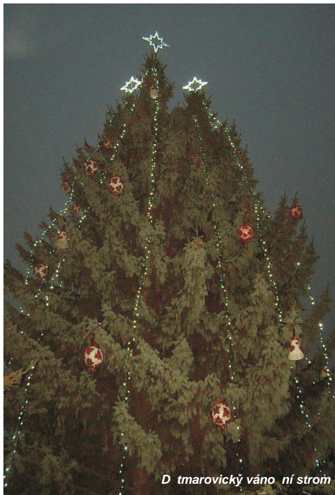
Dětmarovický vánoční strom