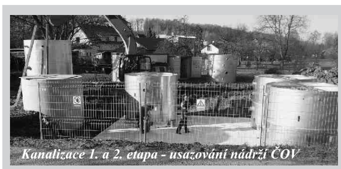
Kanalizace 1. a 2. etapa - usazování nádrží ČOV