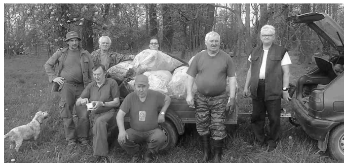
Myslivecká brigáda na jaře - sběr odpadu

Vysoký porost v lese tvoří nejen úkryt pro zvířata, ale bohužel je úkrytem i pro odpady různých druhů, jehož přivodcem je člověk (takzvaný moudrý). V přírodě lehce odhodí tu plastovou láhev, tam pivní flašku, například ve Farském lese najdete aspoň i vydatné skládky z minulosti, jejichž likvidace obec eká. Zbytečný úklid lesa jsme provedli letos na jaře před