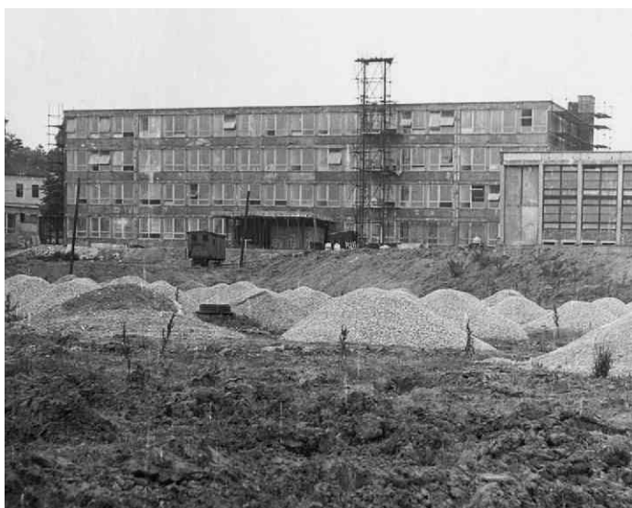
Budova základní školy v roce 1971 krátce před dokončením