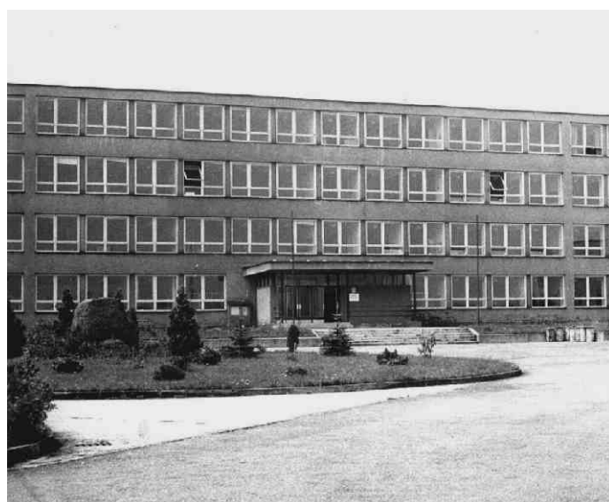
... v polovině sedmdesátých let