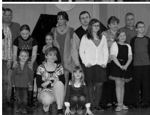
29. března 2011 se konala v koncertní síni ZUŠ v Rychvaldu akce „Mámo, táto, hraj se mnou“. Této zdařilé zábavné akce se účastnilo také několik rodin z Dtmarovic.