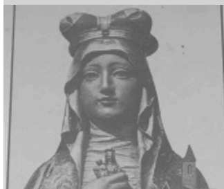
SVATÁ HEDVIKA PATRONKA SLEZSKA

Hedvika se narodila kolem roku 1174 na hradě Andechsu v Bavorsku jako dcera vévody Bertholda IV. Když jí bylo pět let, svěřili rodiče její výchovu sestřím benediktinkám v Kitzingen. Provádala se r. 1186 za slezského vévodu Jindřicha I. a měla s ním čtyři syny a tři dcery.