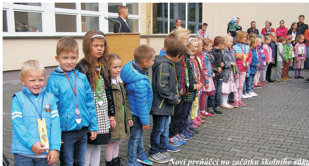
Noví prvňáčci na začátku školního roku

Obec Dětmarovice zároveň sděluje, že tyto informace nemohly být zveřejněny v posledním vydání „Dětmarovického okénka“, jelikož informace o skutečnosti, že práce v souvislosti s realizací stavby pod názvem „Optimalizace trati Český Těšín – Dětmarovice“ budou zahájeny již v měsíci září 2017 uzavírkami komunikací, obec obdržela až v polovině srpna letošního roku.