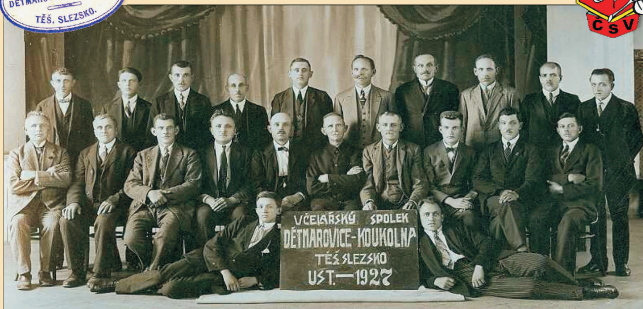
Zakládající členové Včelařského spolku Dětmarovice – Koukolná v sále hostince U Stoklasů v Koukolné.