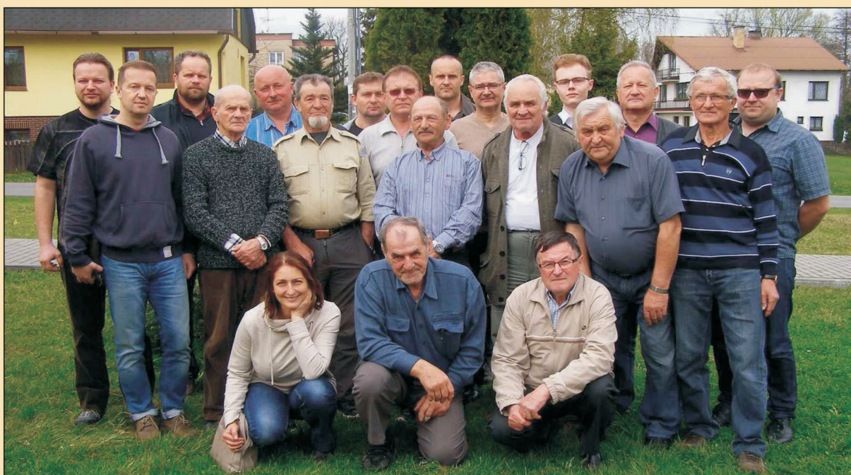
Na členské schůzi ČSV v dubnu 2017. Je škoda, že hodně členů chybělo.